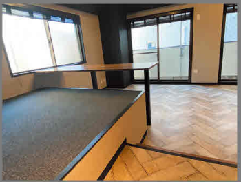
ワーキングスペース